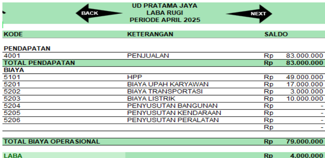
Gambar 4. Laporan Laba Rugi

Output dari aplikasi laporan keuangan yang dibuat ini yaitu 3 komponen laporan keuangan berdasarkan SAK EMKM. Laporan laba rugi dan laporan perubahan ekuitas secara otomatis diambil dari data neraca lajur yang sudah saling terhubung dengan siklus akuntansi sebelumnya.