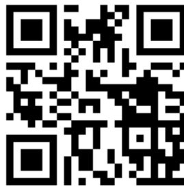
Gambar 2 QR Code Alamat Youtube Analisi Regresi

QR code banyak digunakan di berbagai bidang, seperti spanduk jalan, metode pembayaran dan lain - lain Teknologi QR code masih jarang digunakan dalam Pendidikan. Kemudahan akses penelusuran alamat dalam penggunaan QR code harusnya dapat lebih di kembangkan. Salah satu contoh akses QR Code untuk mempelajari materi analisis regresi adalah sebagai berikut :